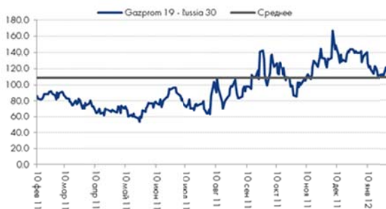
Спред Gazprom 19 - Russia 30